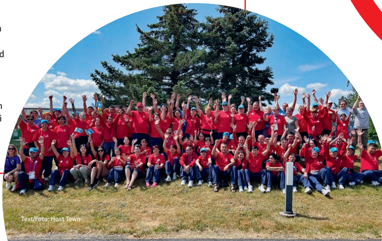
Text/Foto: Host Town